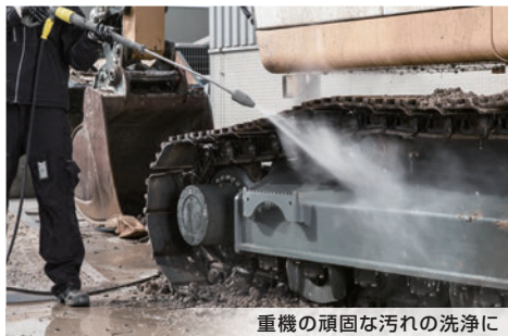
重機の頑固な汚れの洗浄に