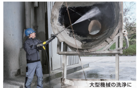
大型機械の洗浄に