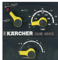
写真はHDS 1000 BE