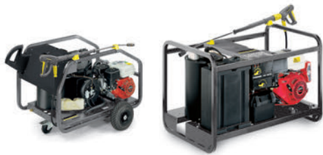
HDS 801 B